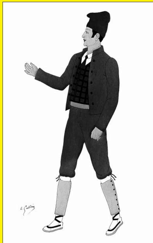
Hombre de Cataluña