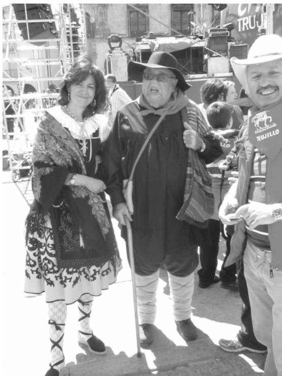
Trajes típicos del Chíviri

El pañuelo rojo al cuello de los hombres y el refajo picado de las mujeres. Preciosos trabajos de orfebrería en los aderezos con primorosas labores en los delantales, en las medias, en los zapatos, llenan de color la Plaza Mayor.