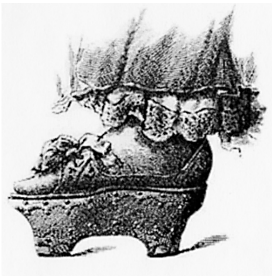
Chapín valenciano. Siglo XVII

La cantidad que el Reino de Castilla concedía por este concepto en cada matrimonio real era de 150.000.000 de maravedís, que se repartían entre los vecinos pecheros que eran “los que los solían y debían pagar” , como se les recordaba con frecuencia.