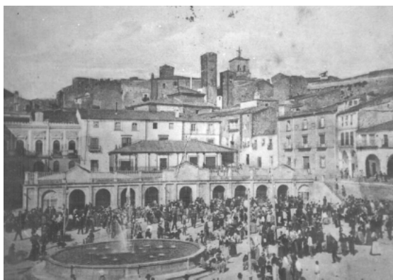
Domingo en la Plaza

Al igual que en las otras poblaciones se celebraba en primavera y siguiendo el Exodo, 12:3-7: "...Ha-