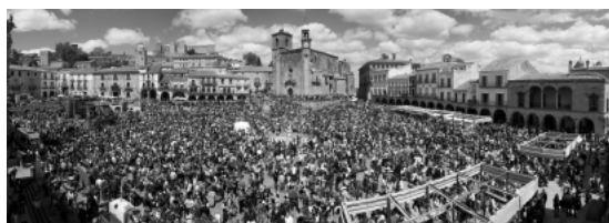
La Plaza de Trujillo

El 30 de septiembre de 1986, en Pleno del Ayuntamiento, se adoptó el acuerdo de solicitar a la Junta de Extremadura la declaración de la misma como Fiesta de Interés Turístico Regional. La Consejería de Turismo, Transportes y Comunicaciones, por Decreto de 13 de junio de 1989, concedió la declaración de Fiesta de Interés Turístico.