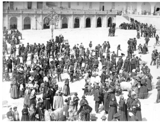
Domingo de Pascuas en 1860

La evolución en el tiempo hizo que el Domingo de Resurrección fuese la gran fiesta de la Pascua en Trujillo. Por tanto, la ceremonia de la Resurrección se anticipaba a la mañana del Sábado de Gloria, pero con el Decreto del año 1952 se anuló este día para el festejo ( recordemos la chispa trujillana en la canción "el Sábado de Gloria don Mariano lo ha quitado..." ). Las celebraciones eucarísticas vespertinas son muy recientes, por eso, la alegría pascual debía celebrarse antes de la tarde, y se podía repetir el domingo. Los niños ya no acuden con sus corderos a la Plaza Mayor ni se comercia ahí con el ganado, pero la alegría desbordante ha realzado la celebración que, simplemente, ha modificado sus formas. "EL CHÍVIRI", que es el nombre del baile que sin cesar bailan los trujillanos y los visitantes en