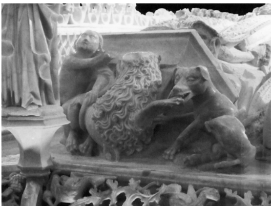
Detalle del sepulcro de Isabel de Portugal en la Cartuja de Miraflores