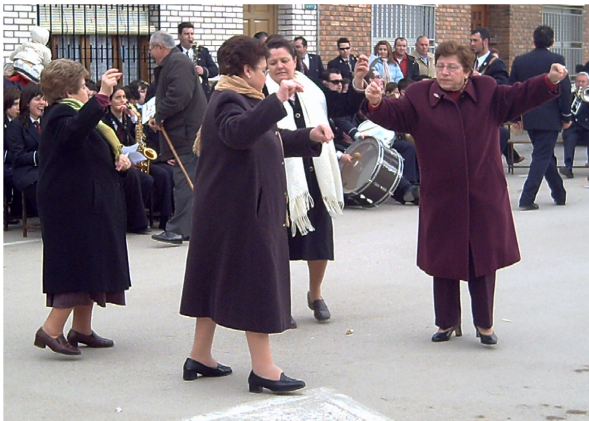
Migueletas bailando la jota pujá. 25 de febrero de 2006.

Con relación a las cuestaciones por las calles y el establecimiento de subastas, pujas y demás acciones con el único objetivo de recaudar dinero para cultos y misas de difuntos en época de carnestolendas, encontramos un antiguo y popular cantar que respalda la naturaleza petitoria de este tiempo: