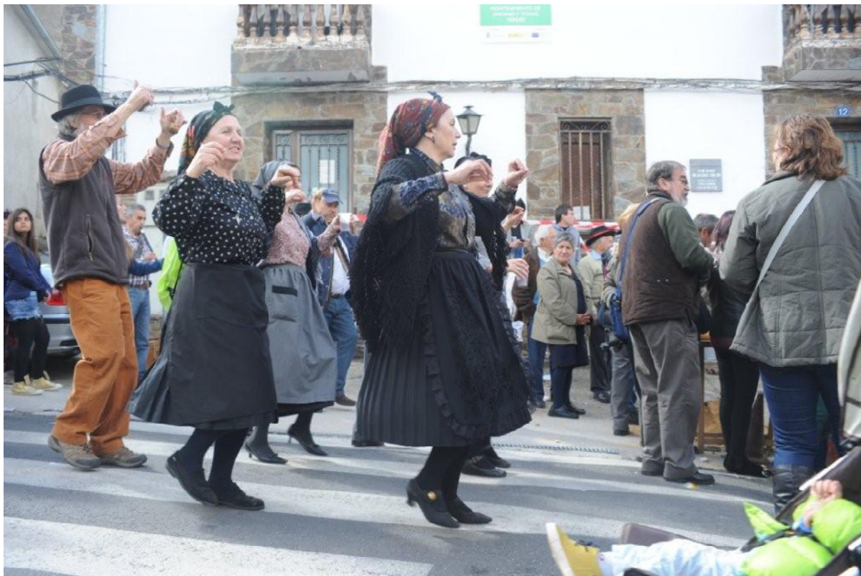
Bailando. Nuñomoral (Las Hurdes).