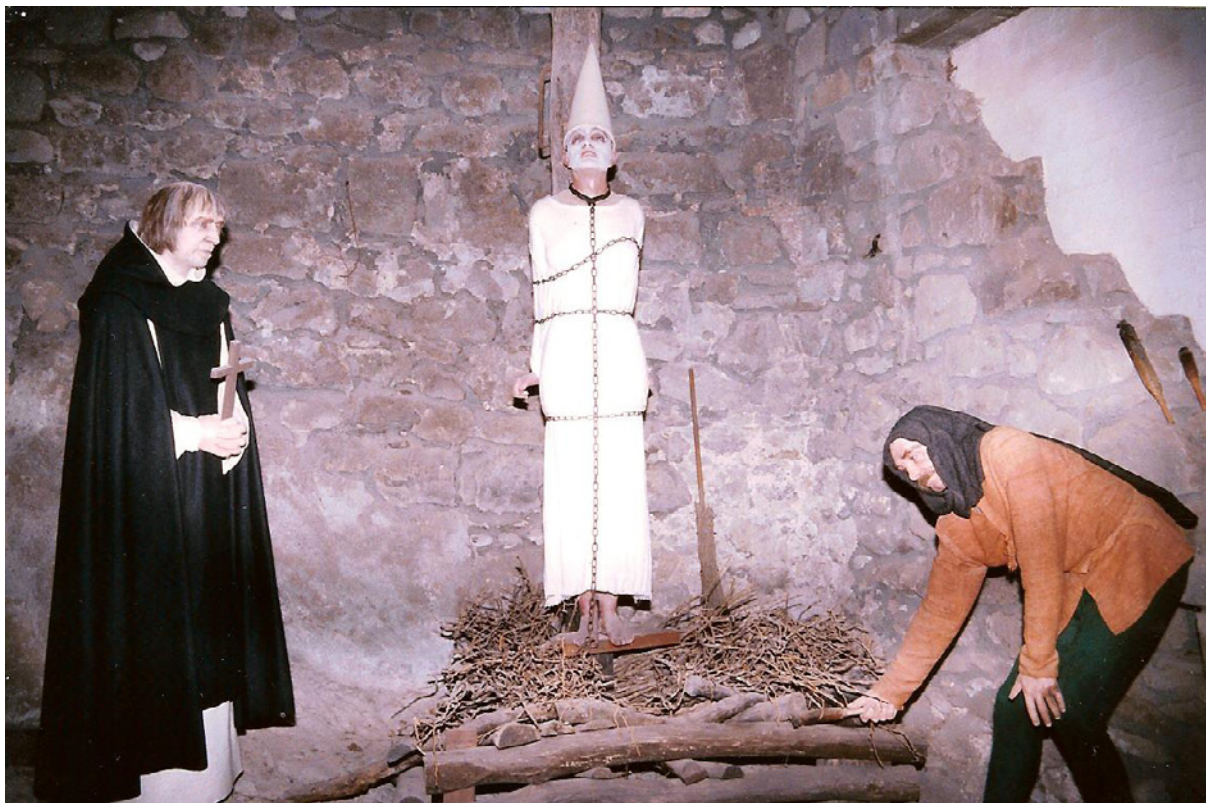
Fortaleza de Vysehrad. Polonia.

nombre, llamando a los Judíos marranos? Muchas razones dan estos graves Autores [...] Otros dicen, que los Españoles les salió este nombre, llamandoles marranos, que en Español quiere decir puercos; y así por infamia les llamaban puercos marranos a los Christianos nuevos, y dábanles, y se les puede dar este nombre con gran propiedad, porque entre los marranos, cuando gruñe, y se quexa uno de ellos, todos los demás puercos o marranos acuden a su gruñido; y como son así los Judíos, que al lamento del uno acuden todos, por eso les dieron título, y nombre de marranos.