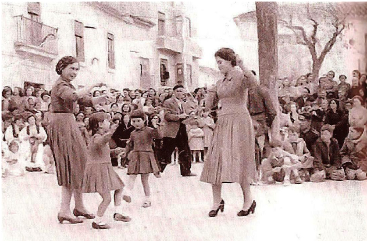
Corro de carnaval dispuesto en la plaza del Ayuntamiento, cuatro migueletas bailando la jota pujá en 1956 11 . Los niños sentados esperando al final del baile para recoger las bolillas de anís y caramelos que las gentes lanzaban a modo de ritual

La forma coreográfica característica de la jota pujá en Miguel Esteban es la disposición de los danzantes en cuadro; es decir, se baila por dos parejas formadas indistintamente por hombres y mujeres. Así pues, además de las mudanzas anteriormente descritas se produce un cambio de posición por parte de los danzantes entre la conclusión de los interludios o estribillos y el comienzo de las coplas que podríamos determinar como el paseo , propio de otros estilos. Es curiosa la forma en que algunas personas mayores ejecutan este paso de jota, que por su manera nos recuerda al arrastrado o arrastre , si bien atiende a usos y costumbres personales. Además de esto, la coreografía de la jota migueleta no se ve enriquecida en manera alguna con otros pasos y mudanzas como son las vueltas, taconeos o punteos de pies en el aire.