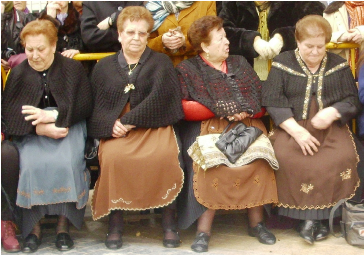
Migueletas ataviadas a la antigua usanza. Miguel Esteban, carnaval de ánimas, 2014.