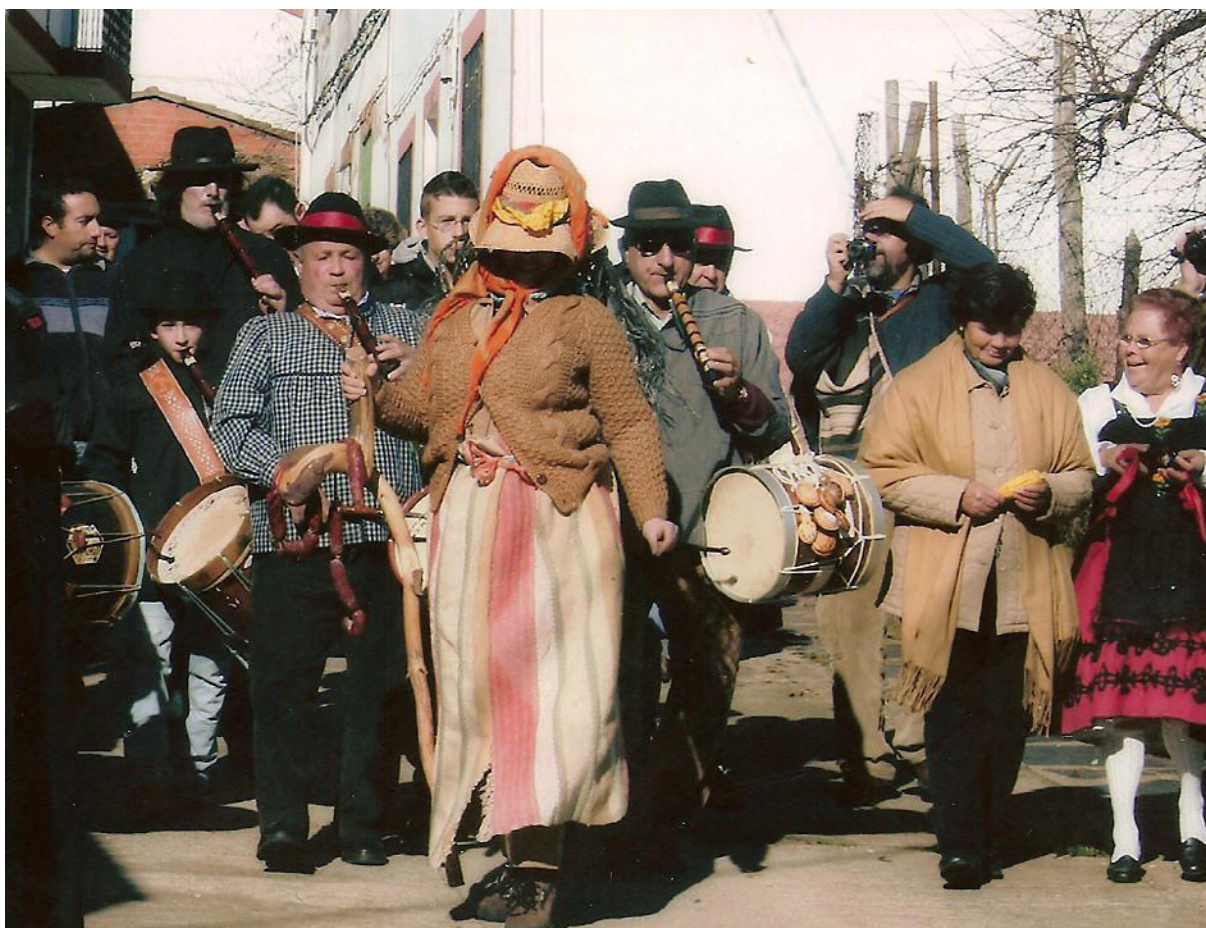
La Chicharrona baja. (El Mesegal).