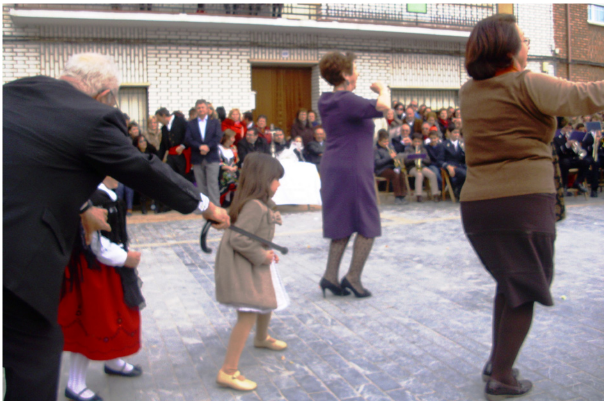
El animero impidiendo el paso a los niños que intentan entrar en el corro a recoger perrillas y caramelos. 2 de marzo de 2014.

Tanto al final del acto de tremolar la bandera como cuando suenan los compases finales de la jota propiamente dicha, se mantiene el ritual de lanzamiento de caramelos y perrillas a los chiquillos, que ávidamente irrumpen en el corro para recogerlas, y a quienes no se ha permitido antes el paso.