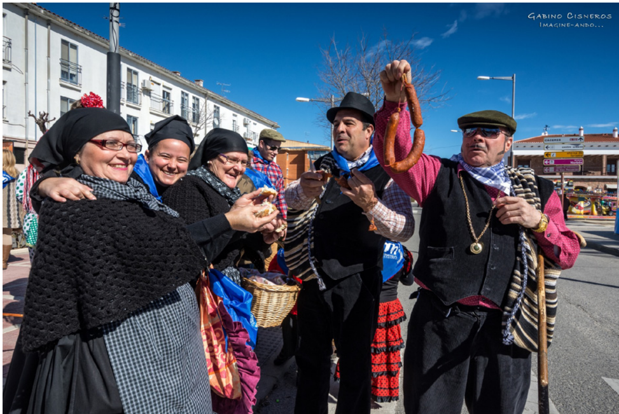
Malpartida de Cáceres. Pedida de la patatera.

Aunque en otras localidades, como Torremocha, eran los solterones quienes salían entonando cánticos locales; o rondas de menos duración que las habituales por el cansancio acumulado durante el día, caso del Puerto de Santa Cruz. Sin embargo, eran más corrientes las bromas a los vecinos. Por ejemplo, en Valdecaballeros (BA), los mozos salían con platos de gachas e iban untando el pomo de los postigos para que, cuando alguien lo asiera, creyera que estaba untado con otra cosa peor. En otras localidades, los mozos que iban de ronda llevaban la pringue arrebañada de las artesas donde se habían hecho las morcillas y chorizos para untar a sus novias y a todo aquel que se les ponía por delante. Y, en cuanto al vecindario, solían esperar a que las mujeres salieran de casa para untarlas. En cambio, en otros pueblos como Monroy, lo más habitual era robar el gallo de quien mataba o de alguno de los asistentes para luego comerlo en la taberna. En la comarca de Las Hurdes —según Félix Barroso— se hacían los pajarínuh , que eran como pellas pequeñas que los mozos arrancaban de la masa del mondongo para procurar untar la cara a las mozas asistentes a las matanzas. Estas escapaban corriendo, pero cuando los jóvenes las alcanzaban les dejaban la cara empimentonada y llena de pequeñas briznas de carne.