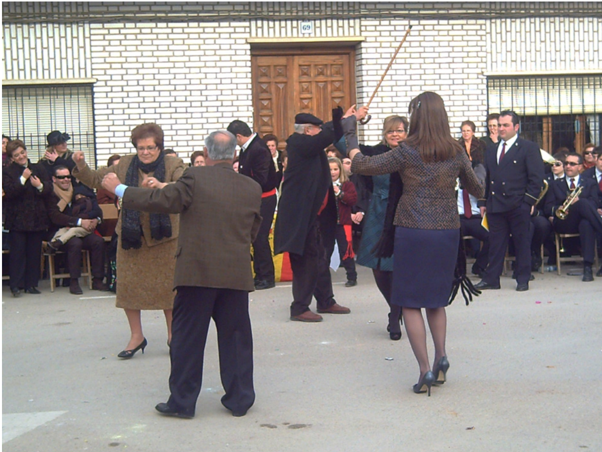
Momento en el que el animero para la jota por haber una puja mayor. 14 de febrero de 2010.