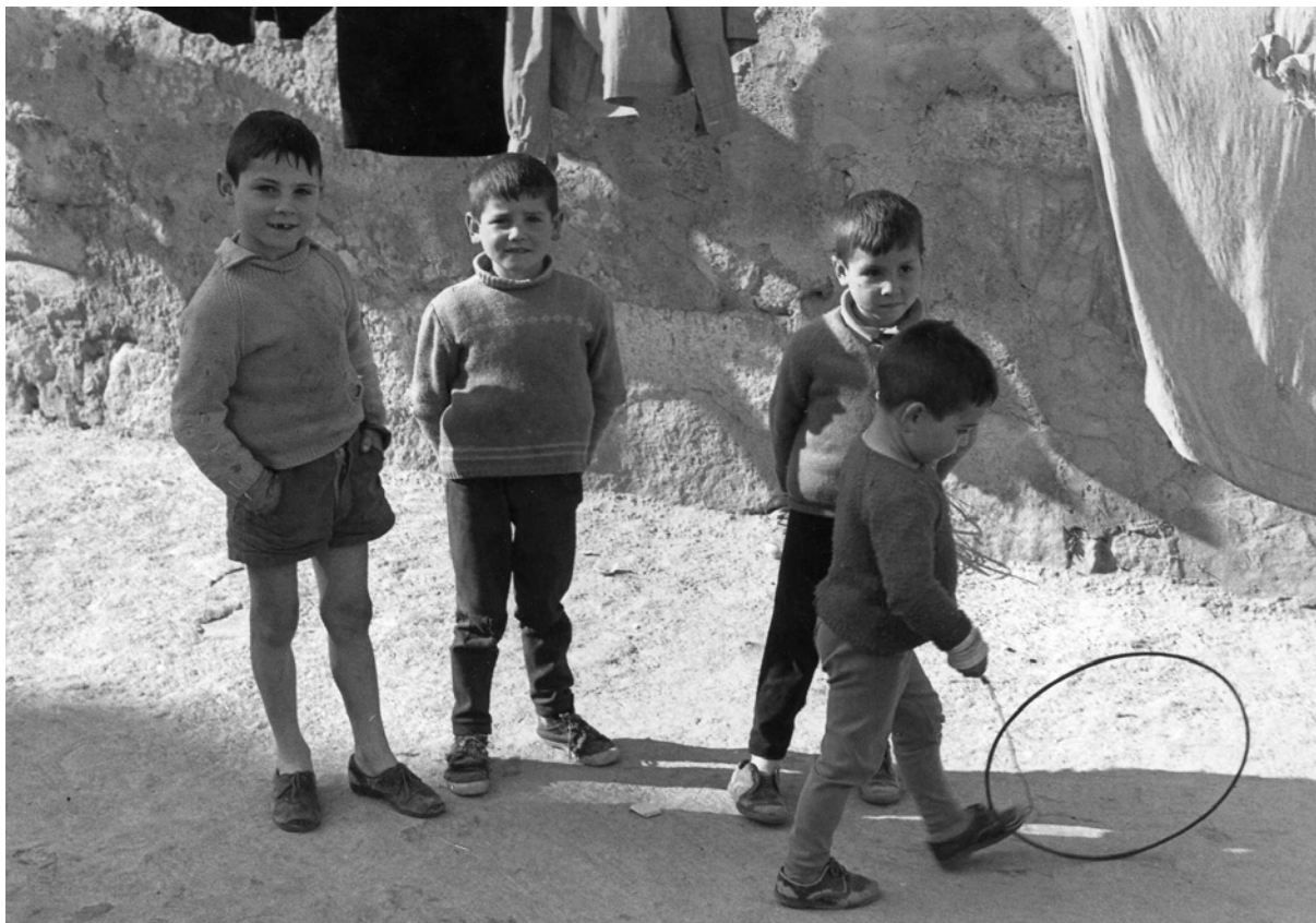
Jugando al aro. Trujillo.

no en todos se respetaba esa tradición matancera, como por ejemplo en Garrovillas. Por lo general, a los más pequeños les hacían un columpio 1 para que no anduviesen estorbando las faenas propias de cada momento. En Trujillo (CC) decían: «Los niños y los perros, a la puerta del chozo».