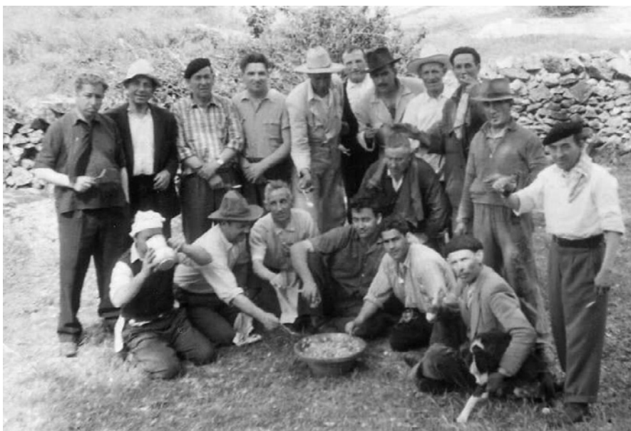
Festejo matancero. Trujillo.