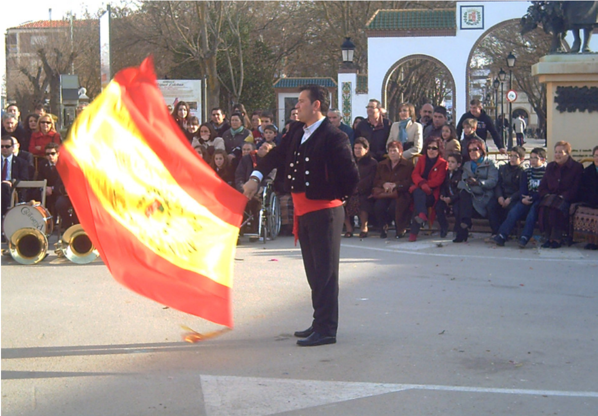
Capitán tremolando la bandera en el centro del corro del carnaval. 14 de febrero de 2010.