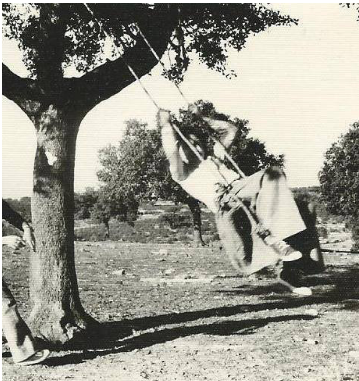
Caballeras. Pescueza.

– Caballeras. Nombre que en Pescueza recibe la forma de columpiarse los niños en las matanzas.