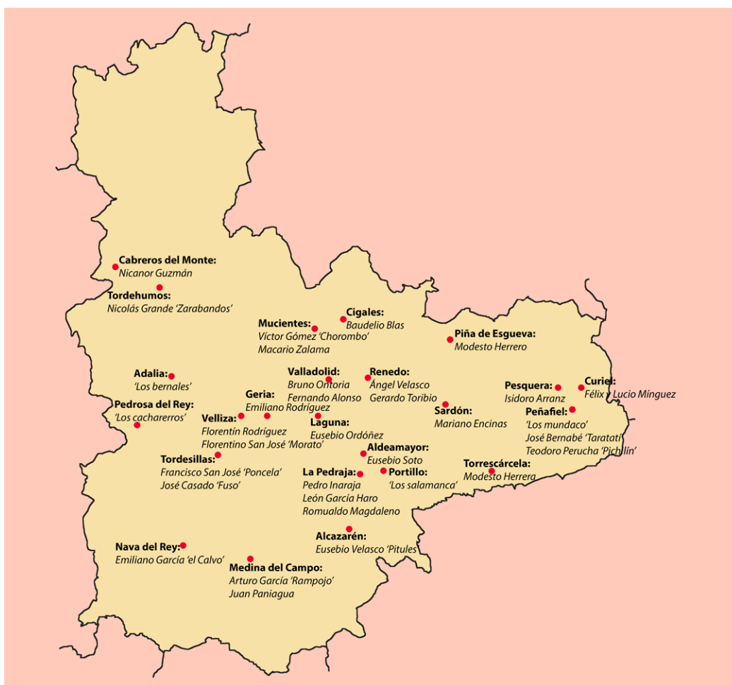
Figura 1. Mapa con dulzaineros de las primeras décadas del siglo xx

La relevancia de este artista no debe hacer olvidar que entonces se desarrollan los años dorados de la dulzaina y abundan sus intérpretes por la provincia (fig. 1). De manera general se aprecia cómo existen músicos de mayor habilidad que son requeridos desde varios pueblos