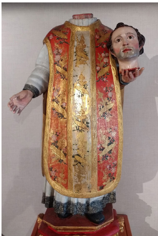
10. San Vítors. Imagen del siglo xvii. San Esteban de Burgos

En Cerezo de Río Tirón, al oriente de la provincia burgalesa, existió una cueva donde fue enterrado San Vítors, el extraordinario santo que batalló contra los musulmanes, quienes le cortaron la cabeza sin que él dejara de predicar, la tomara en la mano y se fuera a su pueblo (fig. 10). Allí se hizo ermitaño en una cueva que estaba habitada por una serpiente, a la que expulsó para quedarse él a vivir allí, y allí mismo está su tumba. Así lo cuenta Juan de Burgos en castellano del siglo xv: