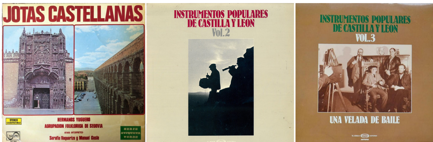
Figura 7. Primeros discos publicados con dulzaineros: Jotas Castellanas (Zafiro, 1974) e Instrumentos populares de Castilla y León vols. 2 y 3 (Moviplay, 1979 y 1981)