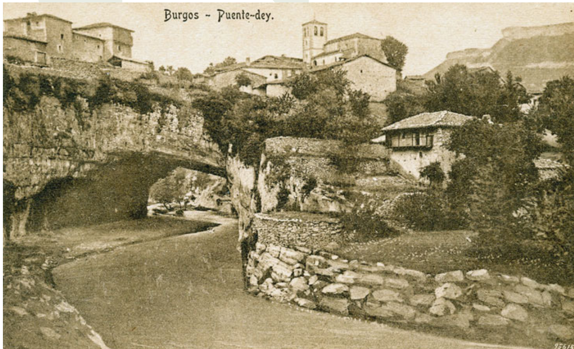
Fig. 1. El río Nela, o su sierpe mitológica, horadó el puente sobre el que se asienta el pueblo de Puente-dey. Sobre él, la casona «de tiempo de los moros» y la iglesia (postal de alrededor de 1930)

E n las montañas cantábricas de Castilla, se han podido conocer algunas leyendas ligadas a ciertos paisajes que nos traen los sonidos lejanos de viejos mitos prehistóricos, como lo son todos los protagonizados por la sierpe divina, o dragón, esa divinidad primigenia cuyas historias se han recogido por todo el mundo. En la cosmogonía de muchos pueblos antiguos, al principio, existía el océano primigenio, que era una deidad y el origen de todo, pues, llegado el momento, ejercerá la función de creador. En algunas mitologías, este océano es una gran serpiente 1 . En el índice de motivos folklóricos universales de S. Thompson, aparece identificado con el número A.13-4-1, la «Serpiente como