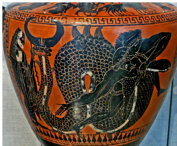
Fig. 7. Heracles lucha con el río Aqueloo. Metropolitan Museum de N. York

que está en sustitución de la realidad. Esta percepción es sobre todo visual, aunque a veces puede tener también rasgos sonoros y olfativos, que, si bien no son tan poderosos como los visuales, tienen poder evocador y convocan en el presente momentos pasados archivados en nuestra mente. Además, hay que tener en cuenta que «para percibir el mundo que nos rodea dependemos de la categorización mediante analogías tanto como de nuestros ojos y oídos» 20 , algo que ya hizo popular J. Fodor con su famosa afirmación de que los humanos tenemos «pasión por la analogía». Por muchos lugares del mundo se encuentra la metáfora que asimila los ríos y fuentes a la serpiente divina. En Grecia, los ríos eran divinidades serpentina a quienes se ofrecían sacrificios y las fuentes, ninfas 21 . El más famoso de los ríos griegos, el Aqueloo, fue pretendiente de Dejanira y por ella luchó con Heracles tomando forma de toro y de una «serpiente de colores brillantes» (fig. 7), como dice Sófocles.