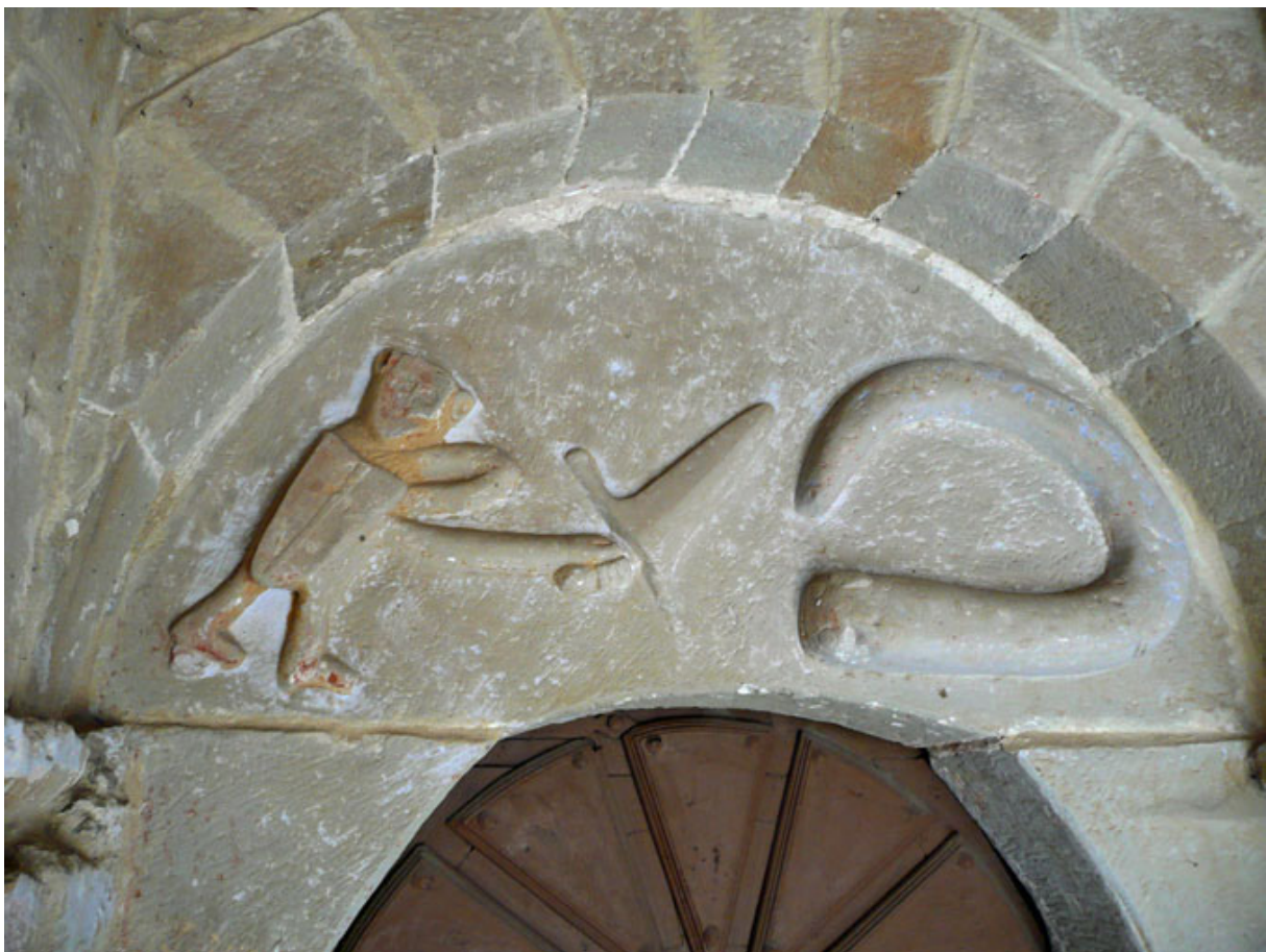
Fig. 2. La serpiente mitológica combate con el héroe. Representación esculpida en la puerta de la iglesia de Puentedey