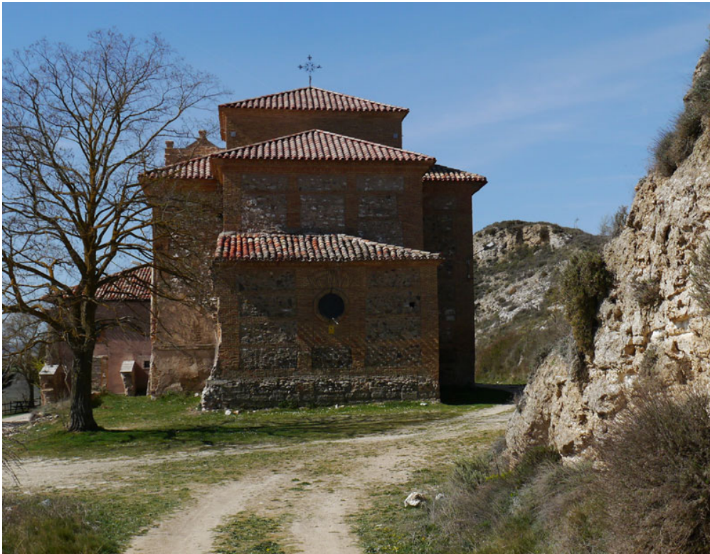
11. Santuario de san Vitores, entre Cerezo y Fresno de Río Tirón, donde estuvo la cueva y está su sepulcro

la realidad, como todas las representaciones. Ya hemos visto que no es ni el territorio ni el medio ambiente, aunque tenga mucho de ambos. Convertir la realidad en representación, o, si se quiere decir de forma más categórica, en ficción es lo que permitió a la humanidad liberarse de la dictadura de la naturaleza, a la que están sometidos los demás animales, y crear la cultura mediante el empleo de signos, el más importante de los cuales es el signo lingüístico, la palabra. La representación nos permite «distanciarse de la cosa como la palabra o el signo en general se distancian de ella para poder “decirla”, para entender su sentido» 32 .