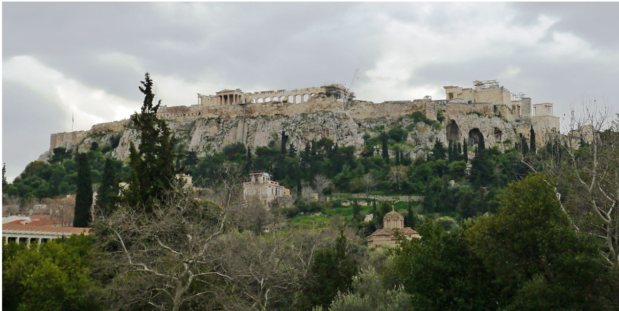
Fig. 9. Cara norte de la Acrópolis de Atenas, donde se hallan las cuevas de Erictonio y Aglauro, y el santuario de «Afrodita en los jardines»

de nacimiento 25 . Por otro lado, el recién nacido se acoge desde que nace a la diosa curótrofa, nutricia, que garantiza la continuidad poblacional de Atenas, y las serpientes cumplen una función claramente protectora 26 . En esta zona estaba también uno de los santuarios de «Afrodita en los jardines», el otro estaba al este, junto al río Iliso, y «las asociaciones míticas y rituales de toda esta zona, por otra parte marcada geológicamente por una serie de anfractuosidades rocosas, presentan esta vertiente norte de la Acrópolis a los ojos de los ciudadanos como un paisaje ctónico, subterráneo, relacionado con la idea de la autoctonía de los reyes míticos de Atenas, nacidos directamente del vientre de la