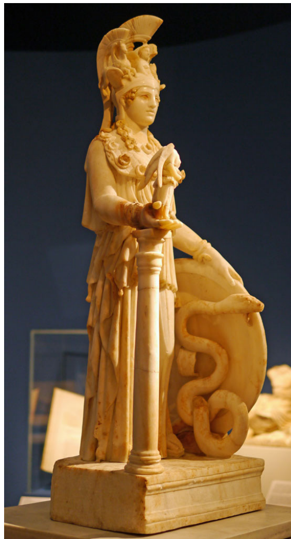
Fig. 8. Atenea Parthenos con la serpiente Erictonio. Museo Arqueológico Nacional de Atenas

sidera que la serpiente que aparece a sus pies puede ser Erictonio 24 .