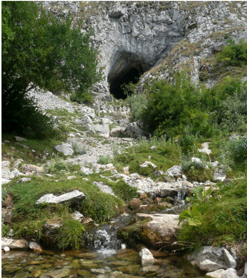
Fig. 6. Nacimiento del río Pisuerga en la Cueva del Cobre (Palencia)