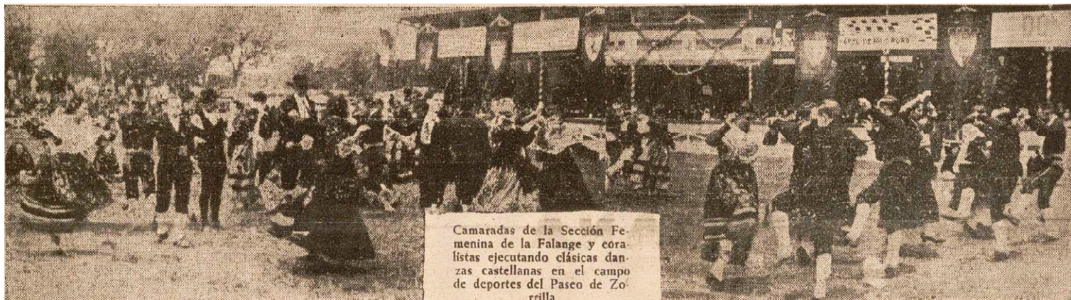
Figura 4. Fiesta de la Victoria en 1939 en Valladolid.

jotas al ritmo de dulzaina y tamboril (fig. 4). Las fiestas de la Victoria se repitieron además en todos los pueblos; entre ellos Medina del Campo, Pollos y La Unión de Campos contaron también con similares parejas de músicos. Algunos años después aún se celebraban algunos homenajes a los caídos en algunos pueblos donde no faltaba el dulzainero, como en Santervás de Campos en 1944 (acudieron además el gobernador civil y el jefe provincial del Movimiento).