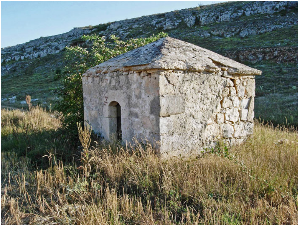
Fig. 5. El santillo, entre Basconcillos y Barrio Panizares

femenino COLUBRA. Esta divinidad la encontramos también en la Fuente del Cobre , en Tubbilla del Lago, en la Ribera del Duero, cercana a otra fuente denominada Ojos del Mar . Todos estos nombres nos están hablando, en efecto, de un valle pantanoso rico en aguas 8 , plagado de fuentes, en una de las cuales habitaba este numen, y que dio nombre al pueblo.