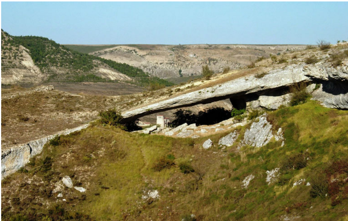
Fig. 3. Puente del Hoyo, «que fue abierto por la serpiente para ir a beber desde su cueva al río Rutón [sic por Rudrón]»; al fondo, Barrio Panizares

No tan conocido ni espectacular es el puente del Hoyo, «puente» también natural en la cercana comarca burgalesa de la Lora (fig. 3), entre los pueblos de Basconcillos y Barrio Panizares, al cual está ligada una serpiente que lo originó y el caballero que la mató, Rodrigo Díaz de Vivar, el Cid 5 . La leyenda más conocida es La patada del Cid , que se refiere a la huella del pie de Rodrigo, que, en el combate contra la serpiente, dejó sobre la roca, así como las huellas de los cascos de su caballo e, incluso, de su lanza. Esta leyenda se centra, por tanto, en el combate del héroe contra el monstruo, si bien aparece también, al final, la creación del puente. Tal como la recogió Pascual Madoz a mediados del siglo XIX dice así: