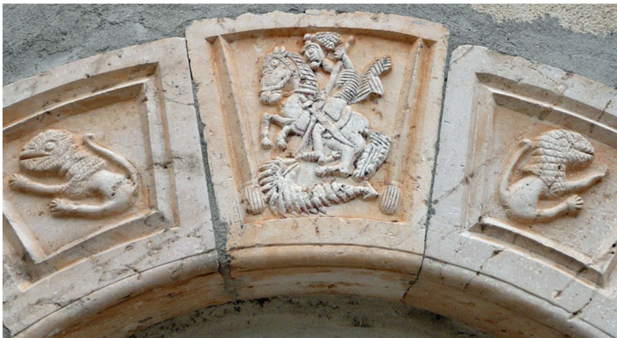
Fig. 4. El héroe mata a la sierpe. Puerta de una casa de Carazo (Bu)

En otros casos no hay propiamente leyendas, pero sí topónimos que pueden conservar un rastro lingüístico de narraciones míticas. En la Montaña Palentina nace uno de los ríos castellanos más importantes, el Pisuerga, nombre actual del ancestral Pisoraca , junto al cual va el camino por donde ya el emperador César Augusto viajó hacia el norte para acabar con los rebeldes cántabros de Peña Amaya. El Pisuerga tiene su nacimiento en la llamada Cueva del Cobre, en el término de Santa María de Redondos (fig. 6). Este «Cobre», el genius loci del río, es el masculino de «cobra» o culebra, procedente del latín COLUBER, forma que coexistía con el